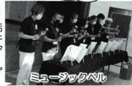
ミュージックベル

各学区の推進協や子ども会などの活動に生かせるレクリエーションのスキル向上のため、ミュージックベル、アイスブレイキング、パネルシアター、バンブーダンス、ペーゴマ、カードゲームなどの研修を行いました。