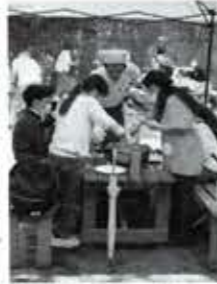
(ちがさき柳島キャンプ場にて)

▶参加希望の方は、「茅ヶ崎市青少年育成」で検索いただくか、青少年課にお問い合わせください。