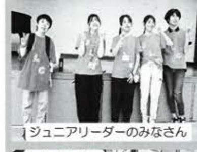
ジュニアリーダーのみなさん