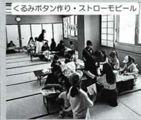
くるみボタン作り・ストローモビール