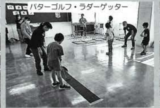
バターゴルフ・ラダーゲッター