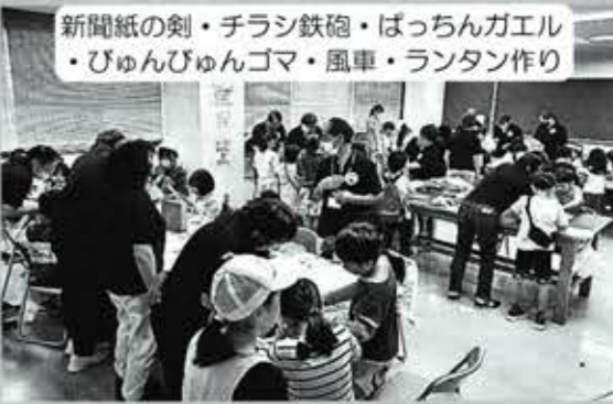
新聞紙の剣・チラシ鉄砲・ばっちゃんガエル ・びゅんびゅんゴマ・風車・ランタン作り