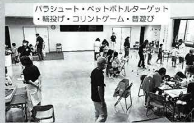
パラシュート・ペットボトルターゲット ・輪投げ・コリントゲーム・昔遊び