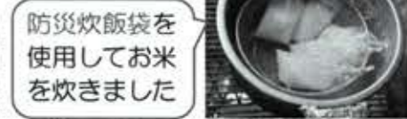
防災炊飯袋を使用してお米を炊きました