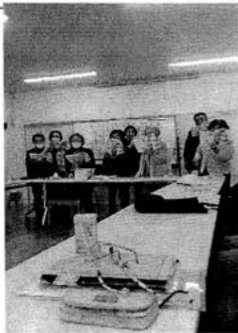
当月定例会での3班の出し物： 全員で童謡・唱歌など数曲を合唱。