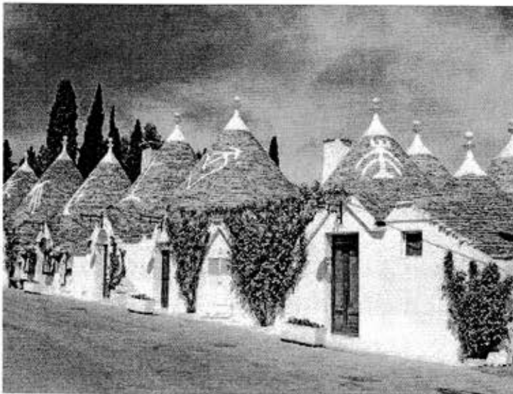
世界遺産 ( イタリア編文化遺産⑨ )